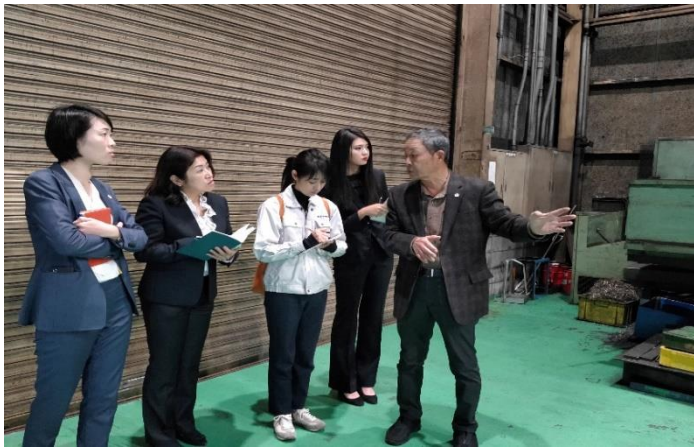
かながた小町 工場見学会風景